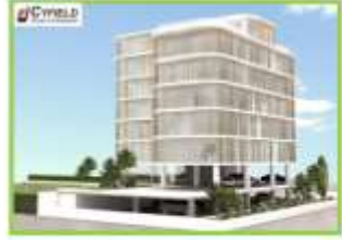
TEARH CHMEP NAFTICE 2020

MEETH EXTENDING EMPLOYERS' LTD TRIPALAIAN AND TIN KATIKOYH KAI AITOTYPIA TPADIAKHE ANATYTIKH THE STAFIASE «CYFIELD GROUP OF COMPANIES» ITO BRNH EPOBOYDY