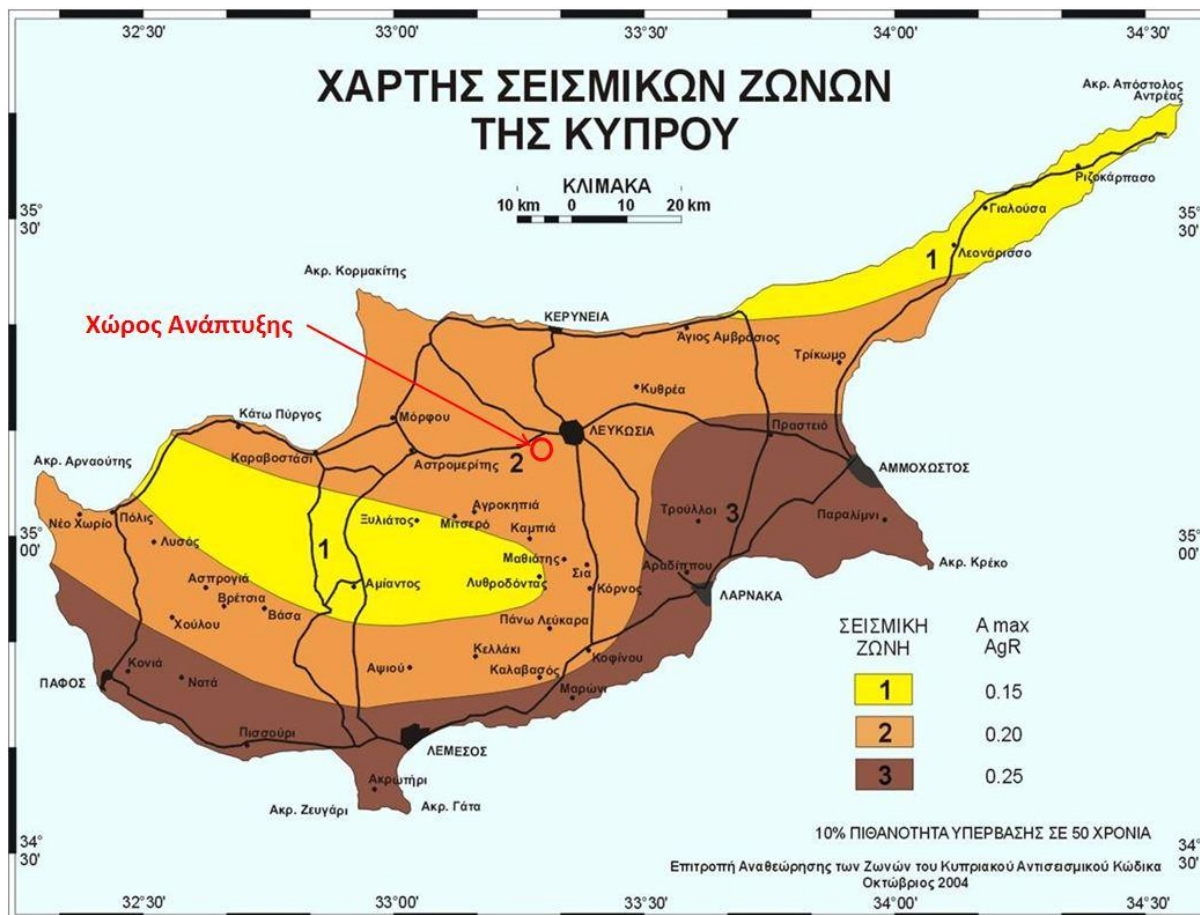
Εικόνα 2: Σεισμικές ζώνες Κύπρου

Επιπρόσθετα, σύμφωνα με τους Χάρτες Επικινδυνότητας Πλημμύρας με υψηλή (1 στα 20 χρόνια), μέση (1 στα 100 χρόνια) και χαμηλή (1 στα 500 χρόνια) πιθανότητα εμφάνισης πλημμύρας, ο χώρος ανάπτυξης του έργου δεν εμπίπτει στις περιοχές δυνητικού σοβαρού προβλήματος κινδύνου πλημμύρας, όπως παρουσιάζεται και στην Εικόνα 3 . Οι χάρτες αυτοί ετοιμάστηκαν από το Τμήμα Αναπτύξεως Υδάτων, στα πλαίσια της Ευρωπαϊκής Οδηγίας 2007/60/ΕΚ για την αξιολόγηση και τη διαχείριση των κινδύνων πλημμύρας.