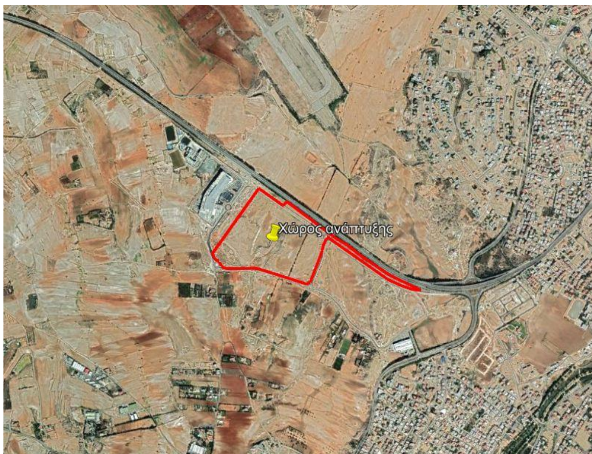
Εικόνα 1: Ευρύτερη Περιοχή Μελέτης

Γενικά σε ακτίνα 1 χλμ από τον χώρο ανάπτυξης υπάρχουν κυρίως άδεια τεμάχια, όπως φαίνεται στην Εικόνα 1 και στις φωτογραφίες στο Παράρτημα ΙΙΙ .