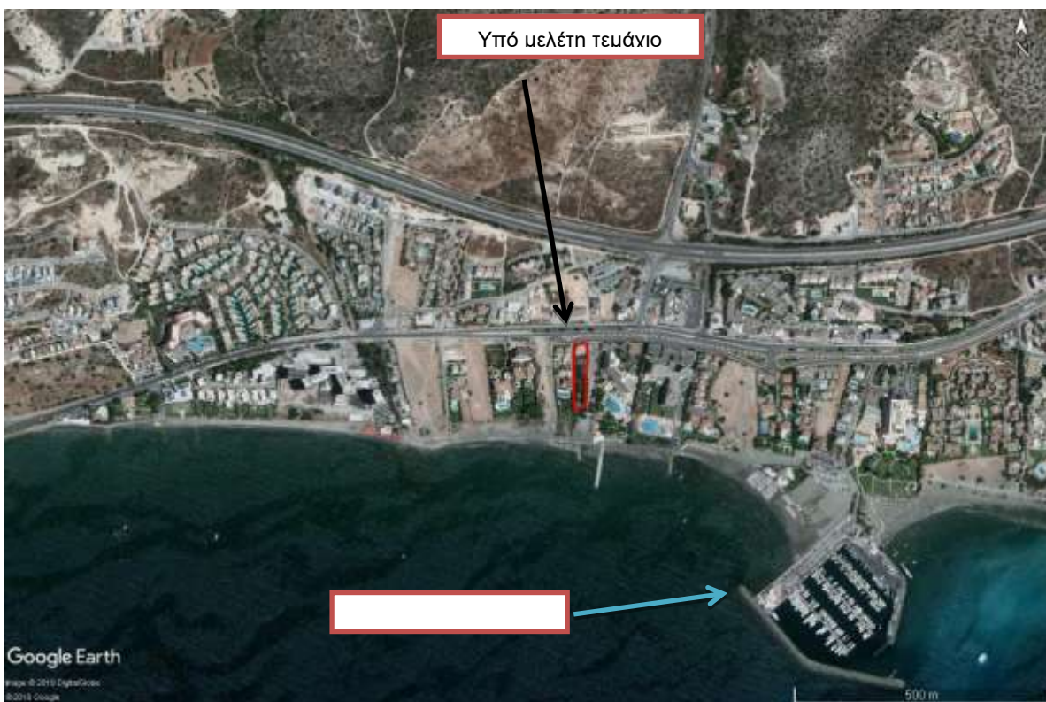
Χάρτης 1 : Γεωγραφική θέση ανάπτυξης

Στην περιοχή μελέτης δεν εντοπίζεται οποιαδήποτε Ζώνη Ειδικής Προστασίας ή Τόπος Κοινοτικής Σημασίας. Η περιοχή Δάσος Λεμεσού CY5000001, βρίσκεται σε απόσταση 5.1 km περίπου βόρεια του έργου. Η Άμεση και Ευρύτερη Περιοχή Μελέτης είναι έντονα ανεπτυγμένη από τουριστικές και οικιστικές αναπτύξεις. Η βλάστηση που παρατηρείται απαρτίζεται από καλλωπιστικά φυτά και φραμούς και ορισμένα δέντρα όπως πεύκα και κυπαρίσσια, κυρίως σε δεντροστοιχίες στις λωρίδες πρασίνου, τα οποία χρησιμοποιούνται για τοπιοτέχνηση. Κατά την επιτόπια επίσκεψη στο υπό μελέτη τεμάχιο έχει διαπιστωθεί έχουν υλοποιηθεί χωματουργικά έργα.