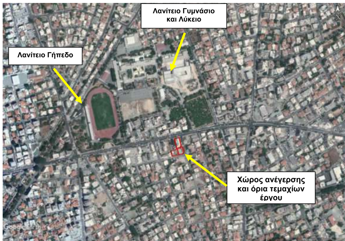
Χάρτης 1 : Τοποθεσία ανάπτυξης (τεμάχια με κόκκινη γραμμή)

Οι χώροι στάθμευσης αυτοκινήτων αποτελούνται από τρία (3) υπόγεια επίπεδα με συνολικά 101 χώρους στάθμευσης εκ των οποίων οι 34 είναι για δημόσια χρήση και οι 11 για είναι για Άτομα Με Ειδικές Ανάγκες (ΑΜΕΑ). Τα υπό μελέτη τεμάχια εντάσσεται σε πολεοδομική ζώνη Εβ3 (εμπορική ζώνη) και Κα3 (οικιστική). Στην περιοχή μελέτης δεν εντοπίζεται οποιαδήποτε Ζώνη Ειδικής Προστασίας ή Τόπος Κοινοτικής Σημασίας. Κατά την επίσκεψη στο χώρο δεν παρατηρήθηκε οποιαδήποτε βλάστηση στα υπό μελέτη τεμάχια, τα οποία είναι περιφραγμένα, παρόλο που δεν φαίνεται να ξεκίνησαν ακόμα οποιεσδήποτε κατασκευαστικές εργασίες.