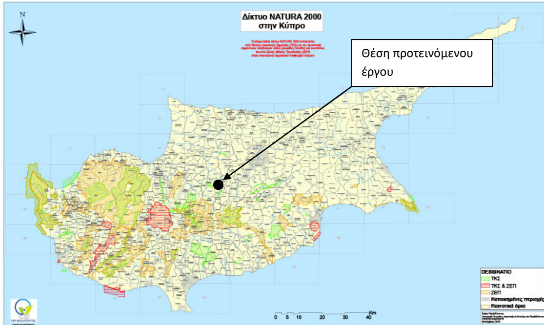
Χάρτης προστατευόμενων ζωνών «ΦΥΣΗ 2000»

απόσταση 2.030 μέτρα, ανατολικά από την περιοχή μελέτης βρίσκεται ο ποταμός Ακακίου σε απόσταση 429 μέτρα, δυτικά βρίσκεται ο ποταμός Περιστερώνας σε απόσταση 8.677 μέτρα, νότια βρίσκεται ο ποταμός Μαρούλλενας (CY2000010) σε απόσταση 2.761 μέτρα και νοτιοδυτικά βρίσκεται η SPA περιοχή βουνοκορφές Μαδαρής – Παπούτσας (CY2000015) σε απόσταση 9.966 μέτρα.