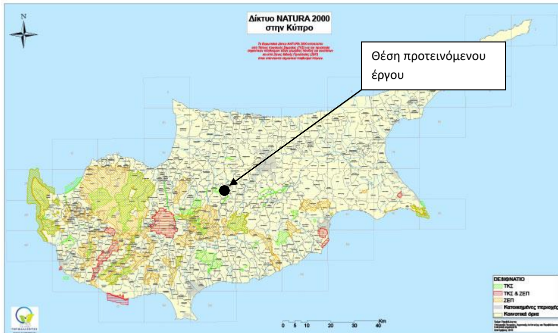
Χάρτης προστατευόμενων ζωνών «ΦΥΣΗ 2000»

2.123 μέτρα, ανατολικά από την περιοχή μελέτης βρίσκεται ο ποταμός Ακακίου σε απόσταση 389 μέτρα, δυτικά βρίσκεται ο ποταμός Περιστερώννας (CY2000011) σε απόσταση 8.771 μέτρα, νότια βρίσκεται ο ποταμός Μαρούλλενας (CY2000010) σε απόσταση 2.670 μέτρα και νοτιοδυτικά βρίσκεται η SPA περιοχή βουνοκορφές Μαδαρής – Παπούτσας (CY2000015) σε απόσταση 10.149 μέτρα.