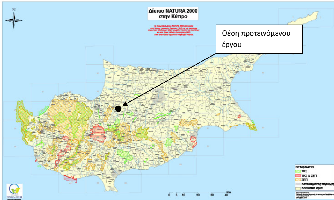
Χάρτης προστατευόμενων ζωνών «ΦΥΣΗ 2000»

Η πιο κοντινή περιοχή που προστατεύεται από το δίκτυο "ΦΥΣΗ 2000", είναι η περιοχή Ατσάς – Άγιος Θεόδωρος (CY2000014), που τοποθετείται νοτιοδυτικά από την περιοχή μελέτης και σε απόσταση 3.461 μέτρα και νοτιοανατολικά βρίσκεται ο ποταμός Περιστερώννας (CY2000011) σε απόσταση 5.540 μέτρα. Επίσης στην περιοχή βρίσκονται ο ποταμός Κούμουρος βορειοανατολικά σε απόσταση 490 μέτρα και ο ποταμός Κασιανός νοτιοδυτικά σε απόσταση 350 μέτρα.