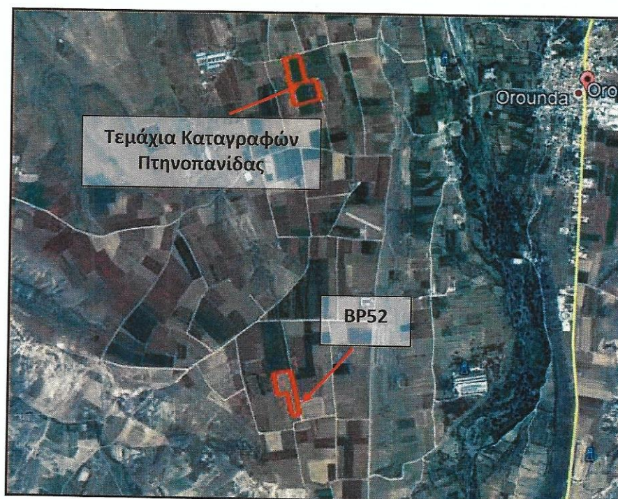
Εικόνα 1: Τεμάχια καταγραφών πτηνοπανίδας

Τα αποτελέσματα των καταγραφών παρουσιάζονται στους Πίνακες 1 και 2, καθώς και στο Διάγραμμα 1.