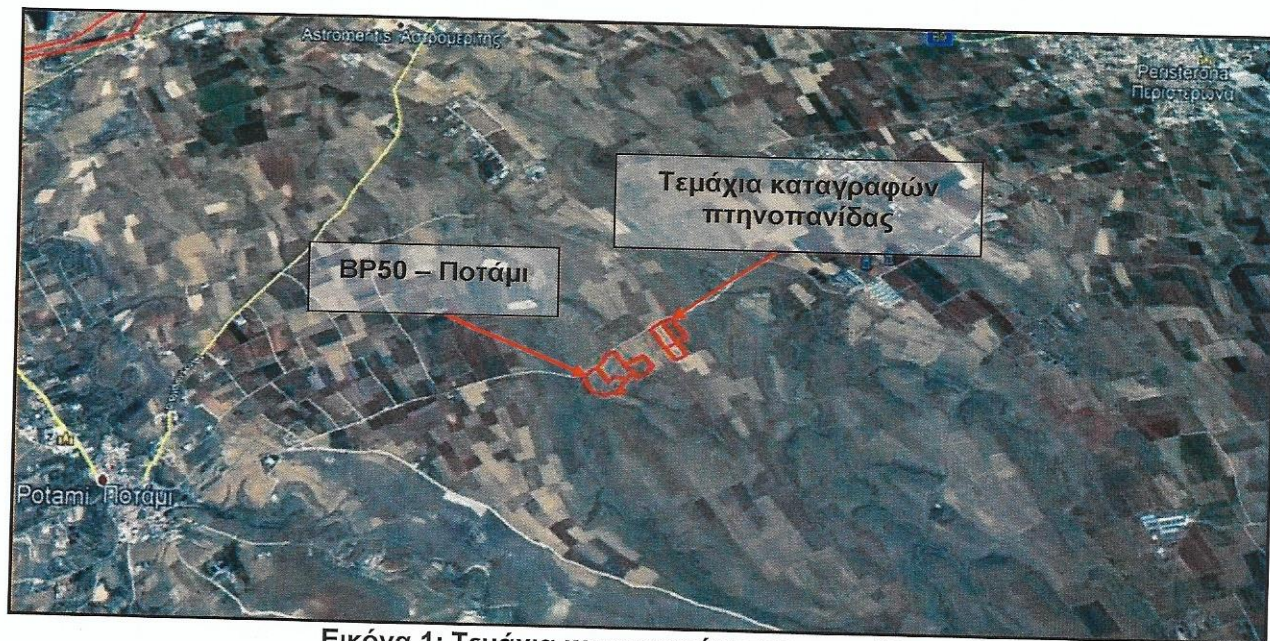
Εικόνα 1: Τεμάχια καταγραφών πτηνοπανίδας

Τα αποτελέσματα των καταγραφών παρουσιάζονται στους Πίνακες 1 και 2, καθώς και στο Διάγραμμα 1.