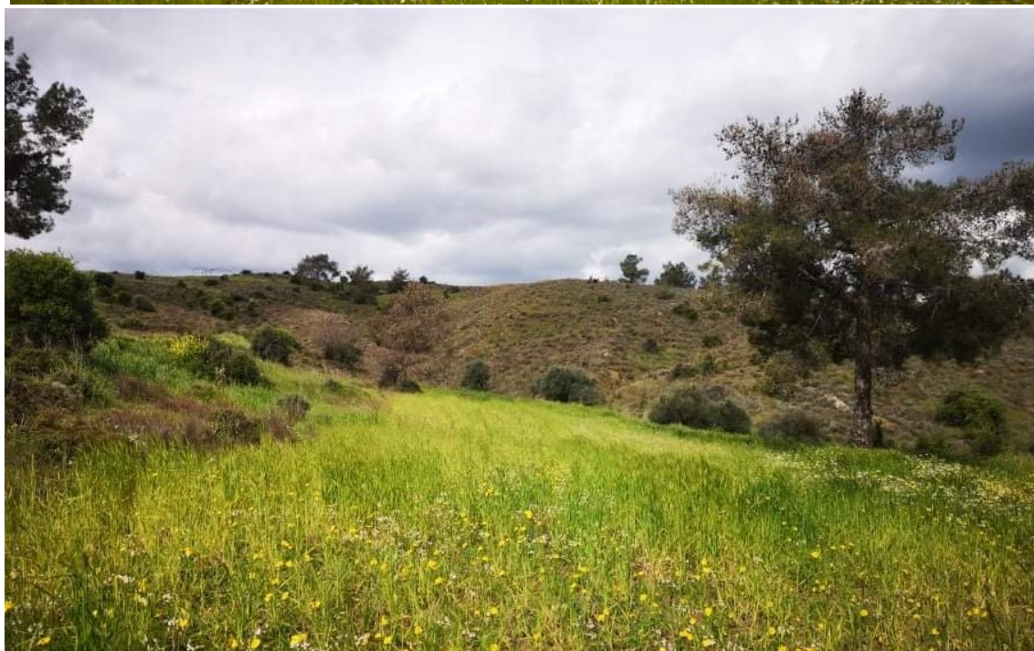
Εικόνα 1. (Α) και (Β) Οικότοποι με φρύγανα εντός του τεμαχίου, σκορπισμένα δέντρα πεύκων, πώδης και αγρωστώδης βλάστησή.