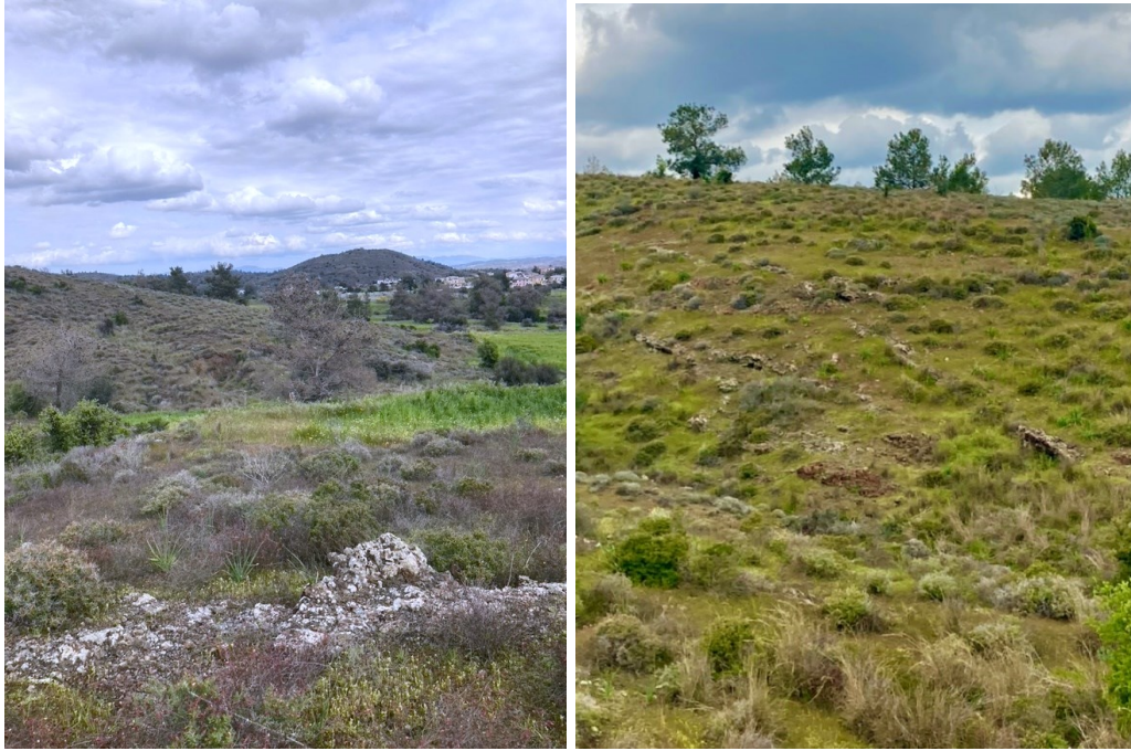
Εικόνα 2. (Α) και (Β) φαίνονται τα είδη που χαρακτηρίζονται από τον οικότοπο με φρύγανα.