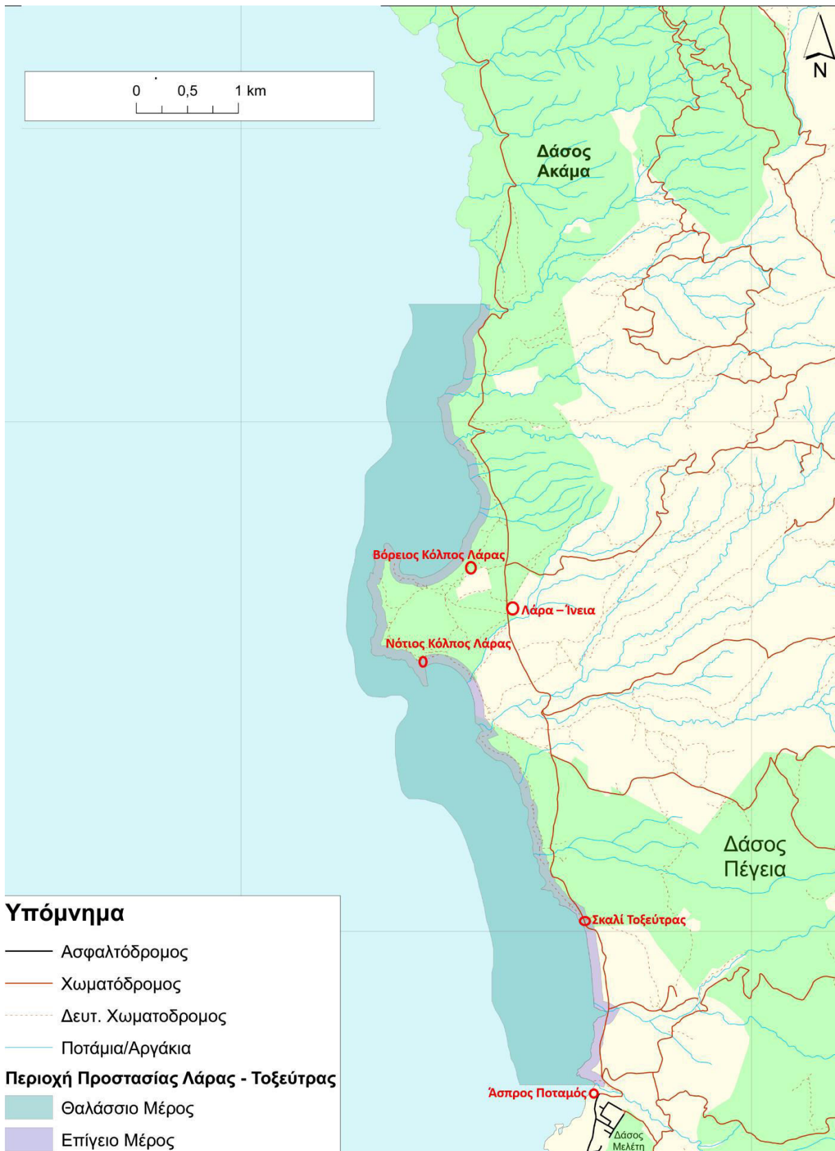
Χάρτης 4: Κόμβοι υποδομών (σε κόκκινους κύκλους) του Εθνικού Δασικού Πάρκου Ακάμα εντός ή/και πλησίον της Θαλάσσιας Προστατευόμενης Περιοχής Λάρας – Τοξεύτρας