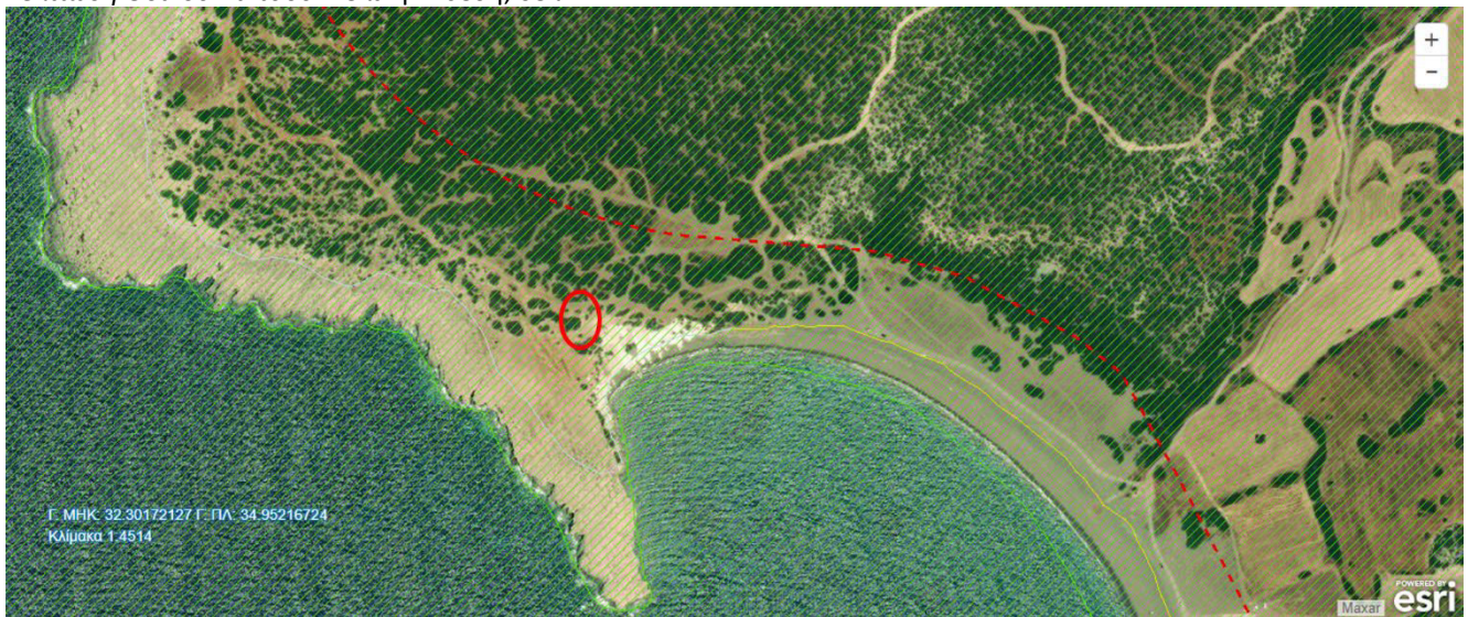
Χάρτης 3: Περιοχή χωροθέτησης Κόμβου 7 – Νότιος Κόλπος Λάρας (με κόκκινο κύκλο)

Νικολαΐδης & Συνεργάτες – Πολιτικοί Μηχανικοί & Μηχανικοί Περιβάλλοντος. Ιανουάριος 2021. «Εικόνα 9: Κόμβος 7 – Νότιος Κόλπος Λάρας», Μελέτη Ειδικής Οικολογικής Αξιολόγησης στο πλαίσιο υλοποίησης του Σχεδίου Αειφόρου Ανάπτυξης του Εθνικού Δασικού Πάρκου Ακάμα για: (α) την Κατασκευή Δεκατεσσάρων Κόμβων Υποδομών και (β) τη Βελτίωση Οδικού Δικτύου . Τελική Έκθεση, σελ. 77.