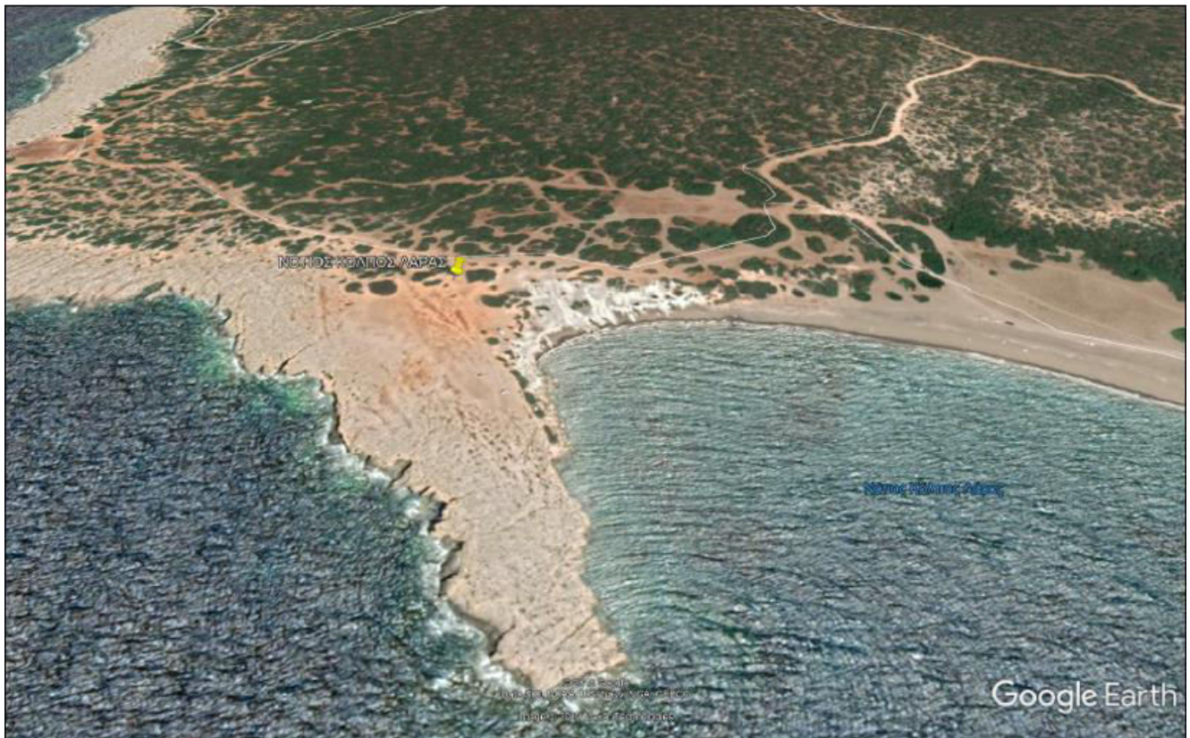
Χάρτης 2: Περιοχή χωροθέτησης Κόμβου 7 – Νότιος Κόλπος Λάρας (με κίτρινη πινέζα)